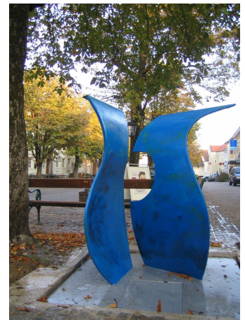
Brunnenskulptur St. Peter/Äu